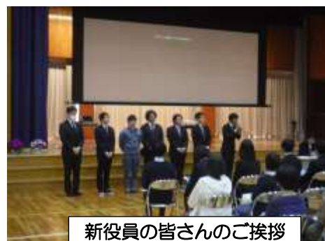
新役員の皆様のご挨拶