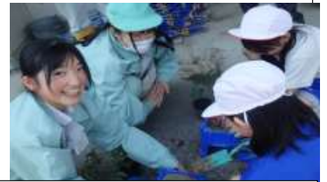
入善高校生と苗を植える2年生

入善高校生と2年生と一緒に「ミニトマト」と「やさい」の苗を植えました。この日から、2年生はミニトマトと野菜の栽培、観察開始。お兄さん、お姉さんが丁寧に教えてくれるので、安心して苗を植えることができました。入善高校の皆さん、ありがとうございました。秋にも花苗と一緒に植える予定です。